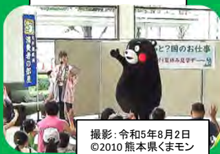
撮影:令和5年8月2日 ©2010 熊本県くまモン