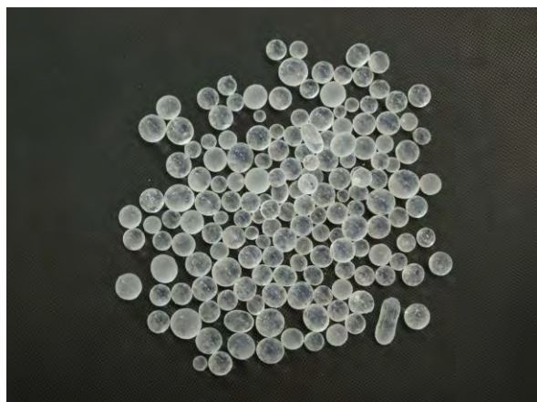
▲ シリカヒドロゲル肥料(1), 現物 力を加えらるとつぶれて粉々になる.