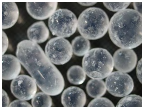
▲ シリカヒドロゲル肥料(1), 実体顕微鏡(10倍)