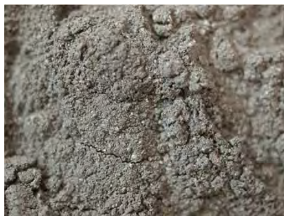
▲ 硫黄及びその化合物(1), 実体顕微鏡(10倍)