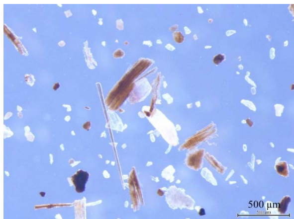
▲ 水産副産物発酵肥料(1):原料割合は魚介残さ70%+内臓10%+畜ふん10%+パーク10%, 実体顕微鏡(アルカリ処理, 107倍)