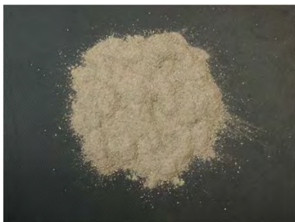
▲ 硫黄及びその化合物(1), 現物 写真の肥料は硫酸と硫黄華の化合物である.