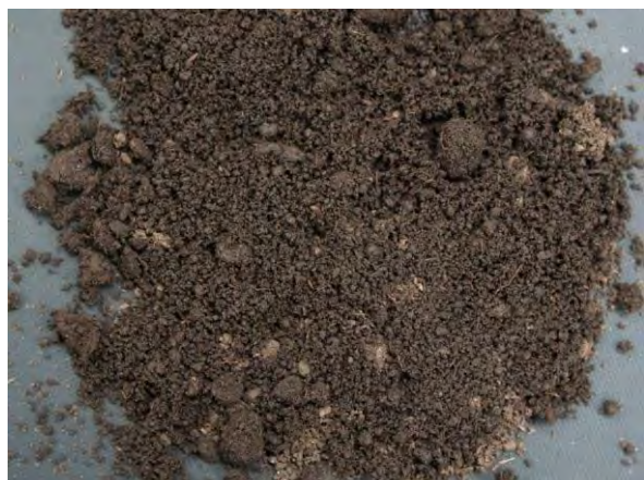
▲ 泥炭(1), 現物