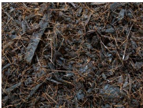
▲ バークたい肥(1), 実体顕微鏡(10倍)