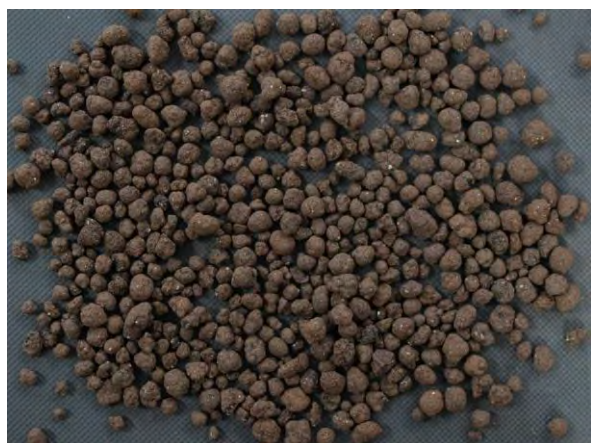
▲ 腐植酸質資材(1), 現物