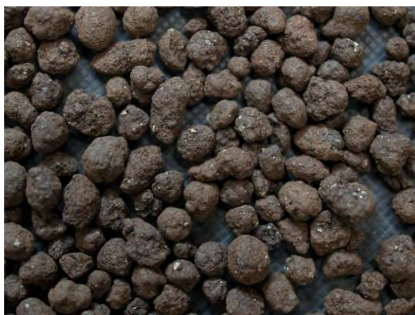
▲ 腐植酸質資材(1), 実体顕微鏡(10倍)