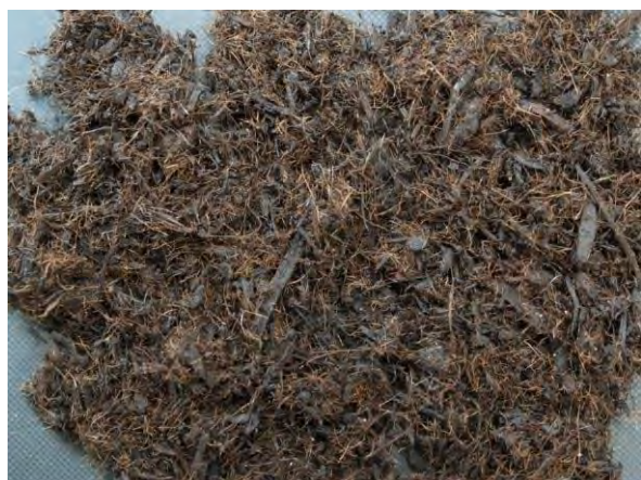
▲ バークたい肥(1), 現物