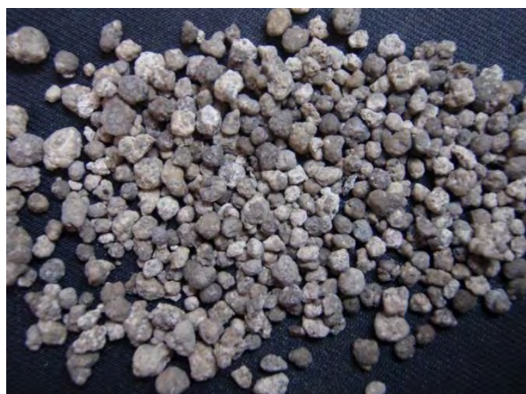
▲ 加工りん酸肥料(1), 現物