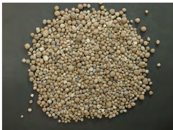
▲ 混合りん酸肥料(1), 現物