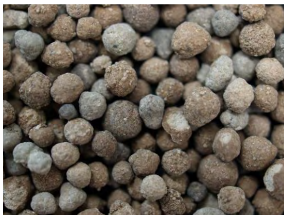
▲ 混合りん酸肥料(1), 実体顕微鏡(10倍)