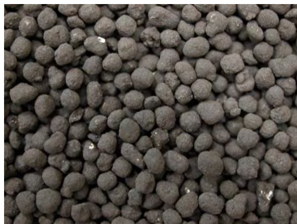
▲ 腐植酸りん肥(1), 実体顕微鏡(10倍)