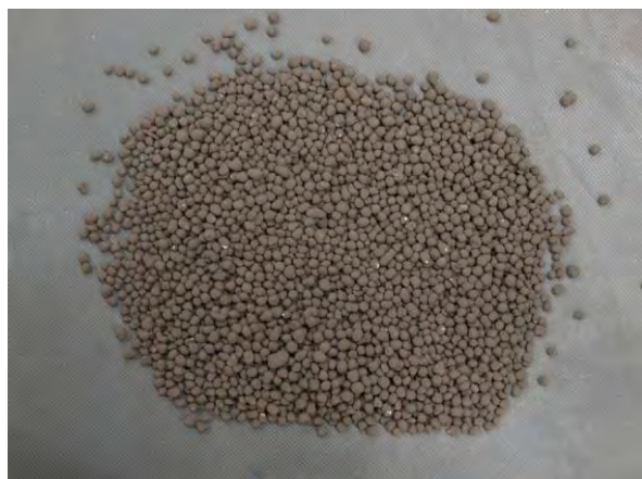
▲ 腐植酸りん肥(1), 現物